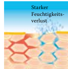
Lipidverlust führt zu einer gestörten Hautbarriere: Die Haut verliert viel Wasser und trocknet aus.

dungen, Juckreiz und Ekzemen neigt. Um diesen Barrierestörungen sowie Fett- und Feuchtigkeitsdefiziten trockener Haut entgegenzuwirken und sie vor weiteren Schäden zu schützen, ist daher sowohl eine regelmäßige Pflege als auch eine schonende Reinigung unerlässlich. Deshalb gibt es von Linola spezielle Produkte, die aufeinander abgestimmt sind und zudem gerade für den Körper, den Kopf, das Gesicht, die Hände oder die Füße besonders geeignet sind. Besuchen Sie uns unter www.linola.de . Denn dort haben wir für Sie alle aktuellen Informationen über Linola Hautmilch , Linola Gesicht , Linola Hand und Linola Fuß-Milch sowie zu weiteren Linola-Produkten bei verschiedenen Hautproblemen bereitgestellt.