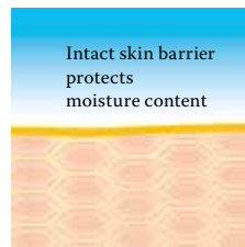
Intact protective skin barrier with lipids rich in linoleic acids.

Regardless of whether there is an internal or external cause, the result is always the same - a dry, flaky and brittle skin, which is more prone to inflammation, itching and eczema. Regular care is vital therefore to counteract this breakdown in barrier func-